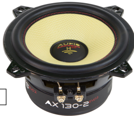
AX130-2 EVO 2